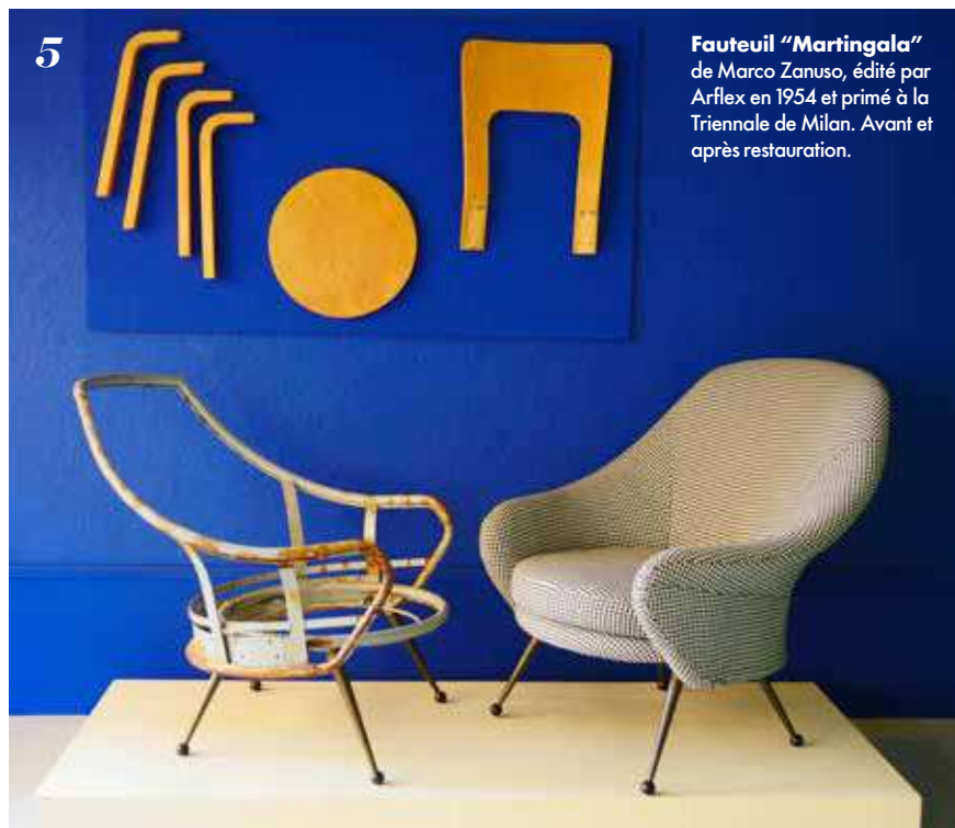
Fauteuil "Martingala" de Marco Zanuso, édité par Arflex en 1954 et primé à la Triennale de Milan. Avant et après restauration.

● 16, rue Fort-Notre Dame, Marseille (04 91 52 25 95). www.relax-factory.com