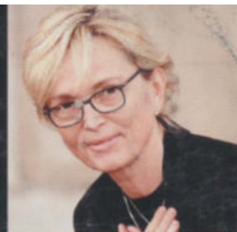
CLAUDE CHIRAC L'HÉRITIÈRE